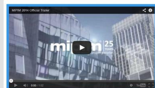
Vidéo de présentation

Notre groupe électrogène de 350 kva et sa cuve seront au rendez-vous. www.mipim.com